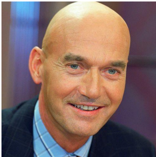
Pim Fortuyn (1948-2002)

Op de rotonde ga je naar rechts, richting station.