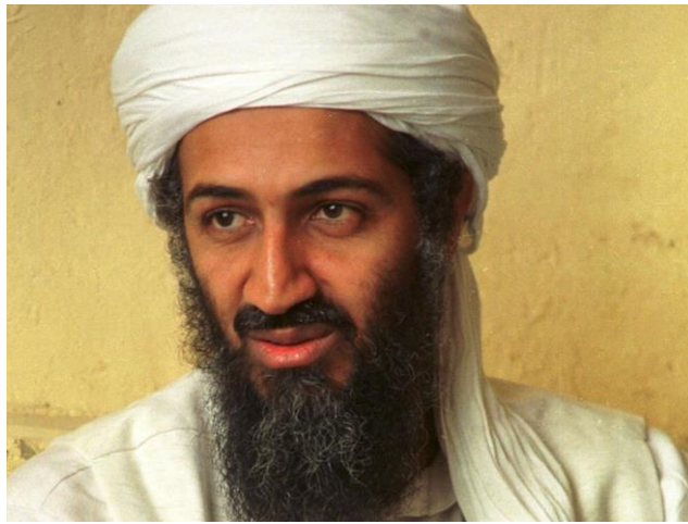
Bin Laden (1957-2011)

Achter de aanslagen zit deze man. Hij heet Bin Laden, een terrorist die zich verbergt in de bergen van Afghanistan. Hoe neemt de Amerikaanse regering wraak?