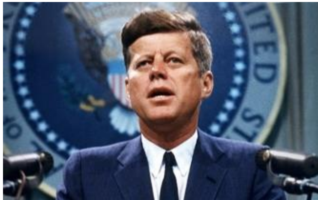
John F. Kennedy (1917-1963)

Ontdek welk verhaal bij deze foto hoort. Wat denk je, is de droom uitgekomen?