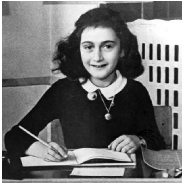
Anne Frank (1929-1945)