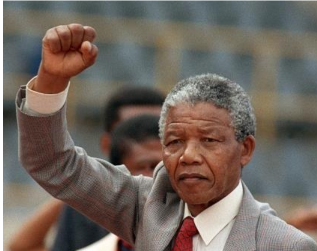
Nelson Mandela (1918-2013)

Loop door naar jaarpaal 1990 om te ontdekken dat er vroeger ook mooie dingen gebeurden.