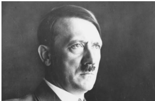
Adolf Hitler (1889-1945)