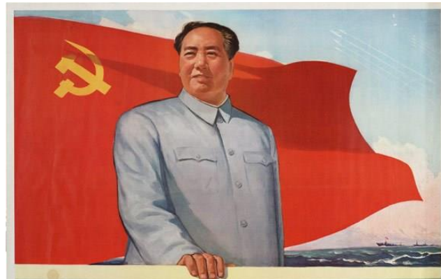
Poster van Mao Zedong (1893-1976)

Precies 25 jaar later (op 11 maart 2011) gebeurt in het Japanse Fukushima eenzelfde soort ramp. Door een zeebeving wordt een kerncentrale daar zo zwaar beschadigd dat er veel levensgevaarlijke straling vrij komt.